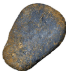
Stone (40,000 B.C.)