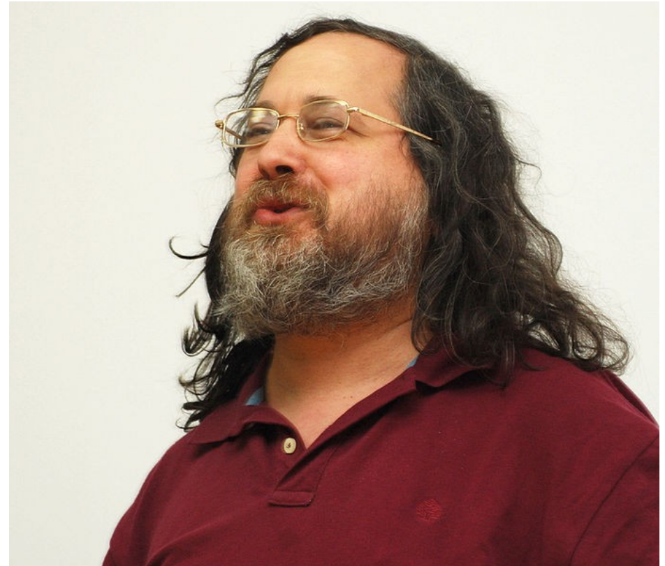
Richard M. Stallman